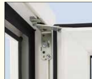
Ansicht des oberen Scherenlagers