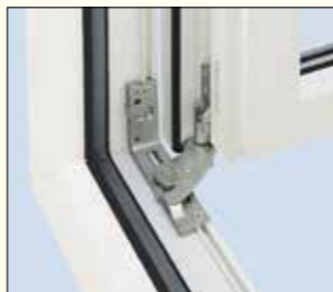
Ansicht des unteren Ecklagers